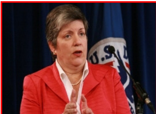
La Secretaria Napolitano propone alternativas a las cárceles.