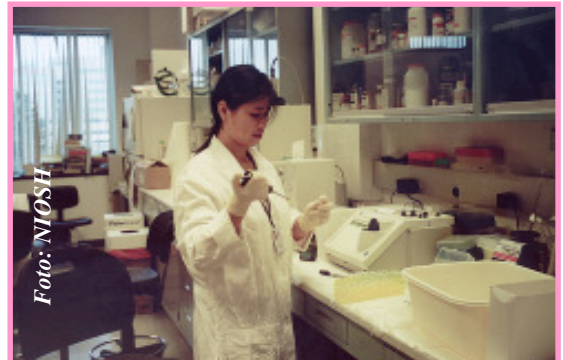
Hay incentivos especiales para minorías.

Y en este otro sitio http://www.nigms.nih.gov/Minority/MARC/PartInstUSTAR.htm las instituciones para el nivel de diplomado.