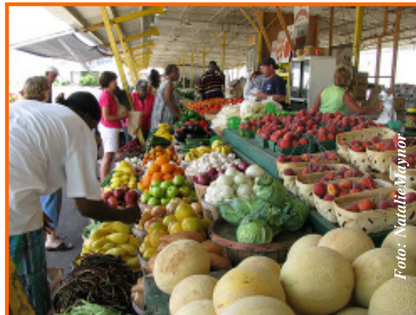
Ahorrar sin bajar la calidad de la alimentación, es posible.

donde usted puede ubicar agricultores comunitarios de su zona: http://www.localharvest.org/csa/ En el mapa