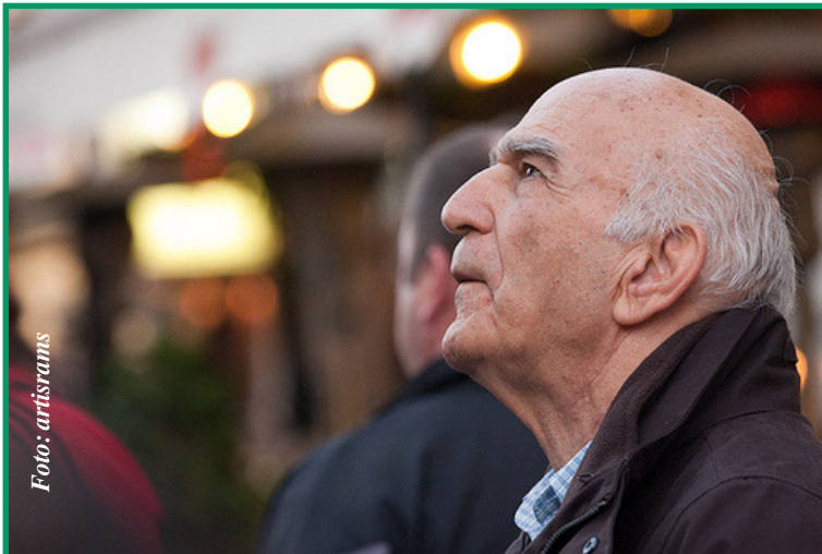
Hay muchas formas de abuso a esta frágil edad.

E l maltrato al adulto mayor es un problema creciente. Aunque no sabemos cómo detener su crecimiento, el interés y la participación de gente como usted es muy importante, ya que podría detectar las señales de un posible problema y hacer una llamada para pedir ayuda.